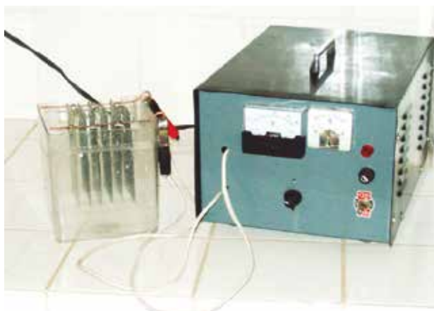
Figura 1. Reactor electroquímico y fuente de poder.